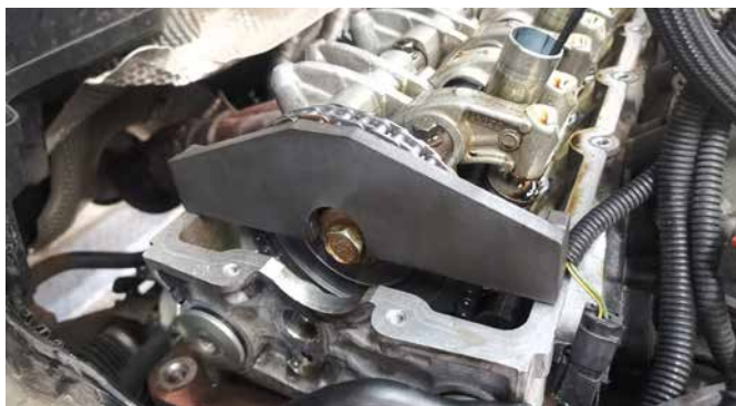
Mothållare för Kamaxel 120459